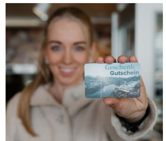
Schenken leicht gemacht – mit dem vielseitigen Gutschein von Amden Weesen.