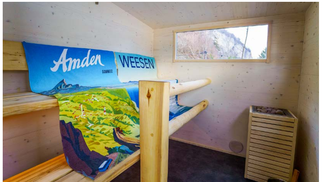
Auch diese Wintersaison sorgt die LÖLY-Sauna für Wohlfühlmomente am Walensee.

Im Vergleich zur vergangenen Saison stehen den Saunagästen nun ein Umkleide- und Aufenthaltsraum mit Liegemöglichkeiten sowie eine neue Aussendusche zur Verfügung.