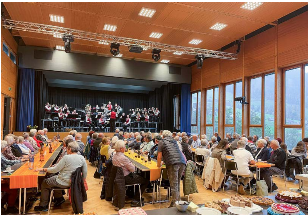
Gut besucht: Die Gäste lauschen den Klängen der Musikgesellschaft.