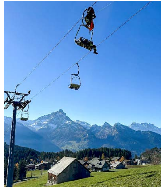
Die Hilfe ist da: Ein Feuerwehrmann rettet zwei Passagiere im Rahmen der Bergungsübung.

Beim abschliessenden Debriefing wurden die Abläufe gemeinsam analysiert und wertvolle Hinweise für kommende Übungen festgehalten. Zum Abschluss lud die Sportbahnen Amden AG alle Teilnehmenden zu einem gemeinsamen Mittagessen ein – als Zeichen der guten und bewährten Zusammenarbeit zwischen Bahn und Feuerwehr.