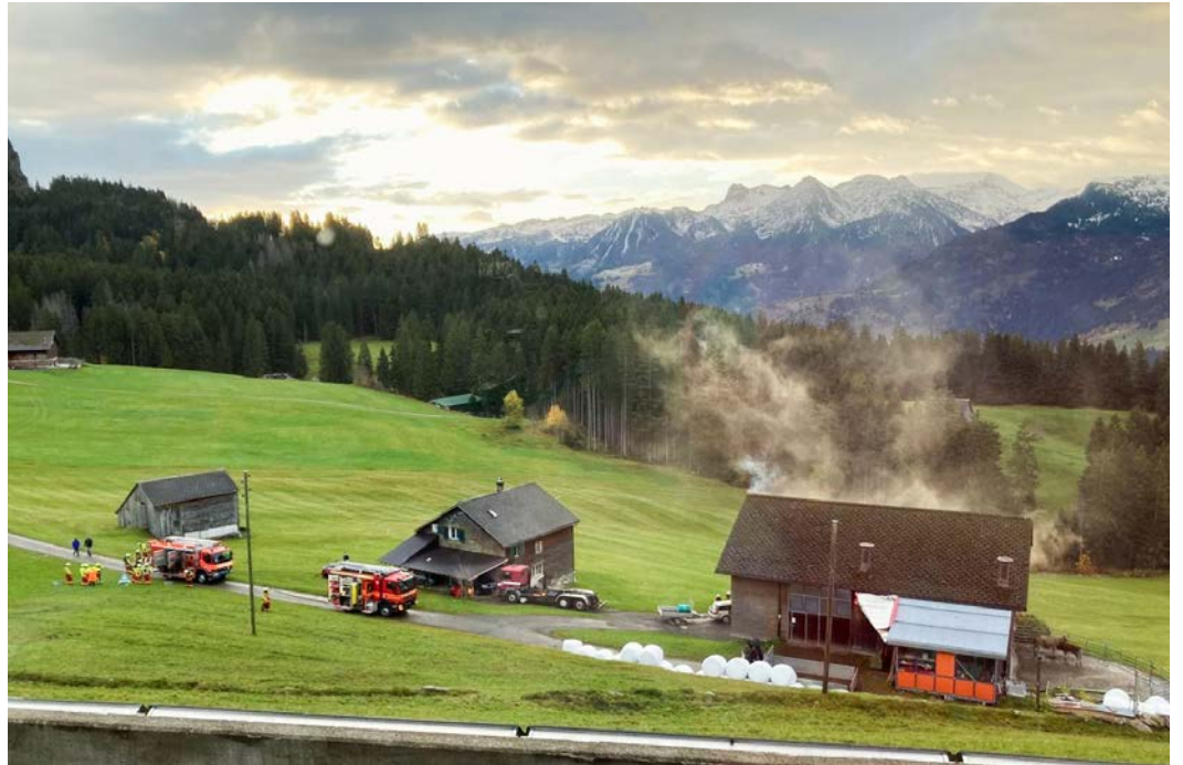
Bei der Hauptübung im Hinterstock stand der Stall im Fokus der Übung.

Im Hinterstock wurde eine Wasserleitung von fast 700 Metern vom Seerenbach her gelegt und mit der Motorspritze das Wasser zum Tanklöschfahrzeug gepumpt. Damit die Übung möglichst der Realität entsprach, sind auch Verletzte, sogenannte Figuranten, vorbereitet worden. Dafür zuständig waren die fünf Samariter, welche fester Bestand der Feuerwehr Amden sind. Feuerwehrmänner haben zuvor die Verletzten mit Atemschutzgeräten aus der Gefahrenzone geholt oder mit Spezialwerkzeug das Auto geöffnet.