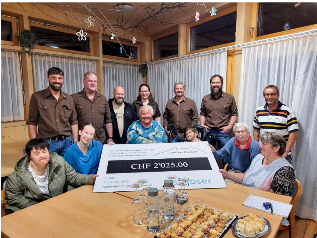
Übergabe der Spende an das Wohnheim St. Josef

An dieser Stelle möchten wir uns bei allen Spendern und Helfern bedanken, die es ermöglicht haben, dem Wohnheim St. Josef diesen schönen Zustupf zu überreichen.