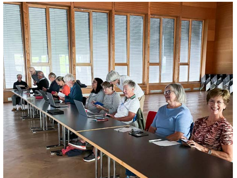
Dank KI Computerprobleme selbst lösen