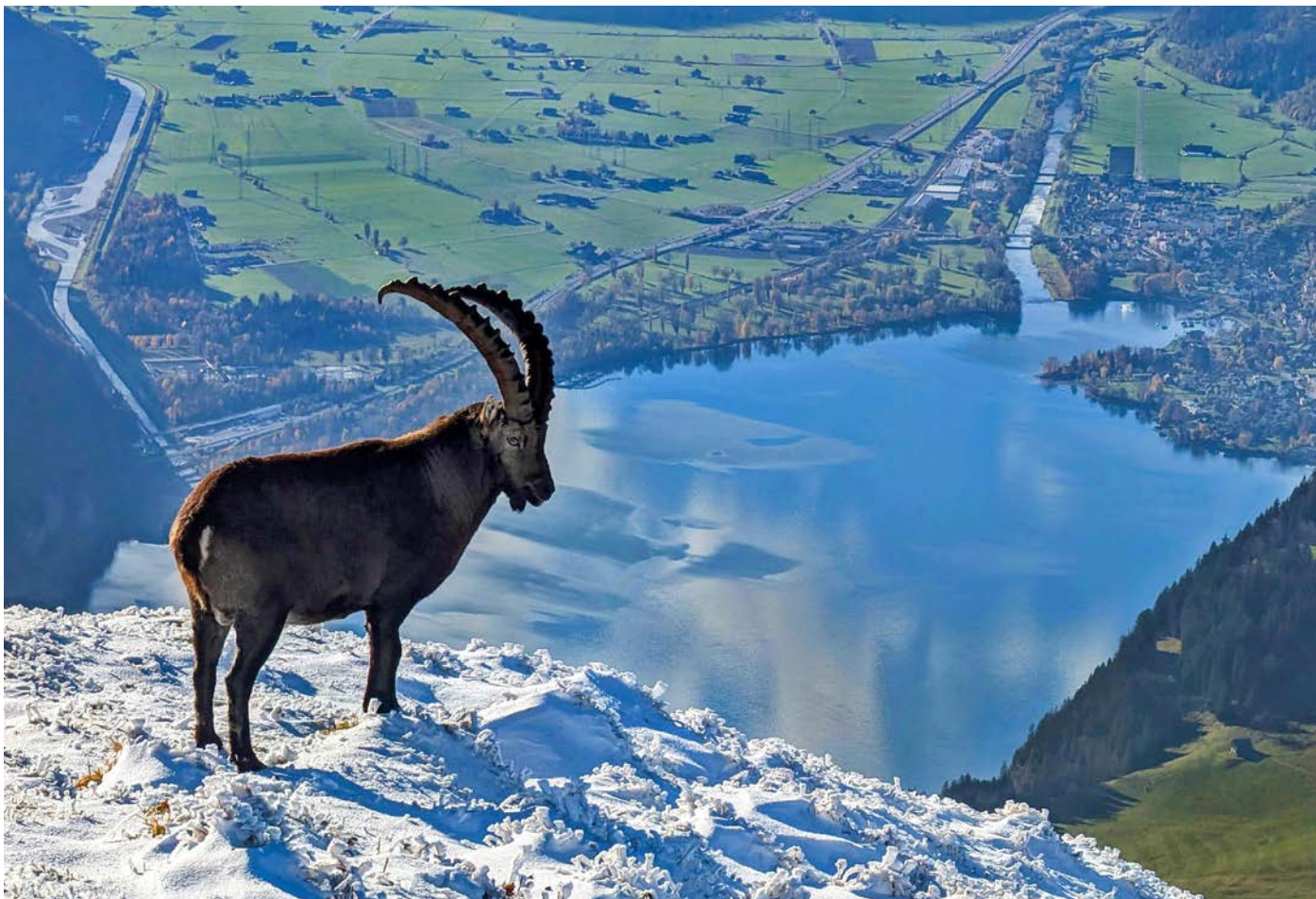
Besuch auf dem Leistkamm am 3. November

Die Stiftung dankt allen, die mitgemacht haben, für ihr grosses Interesse und die engagierte Teilnahme.