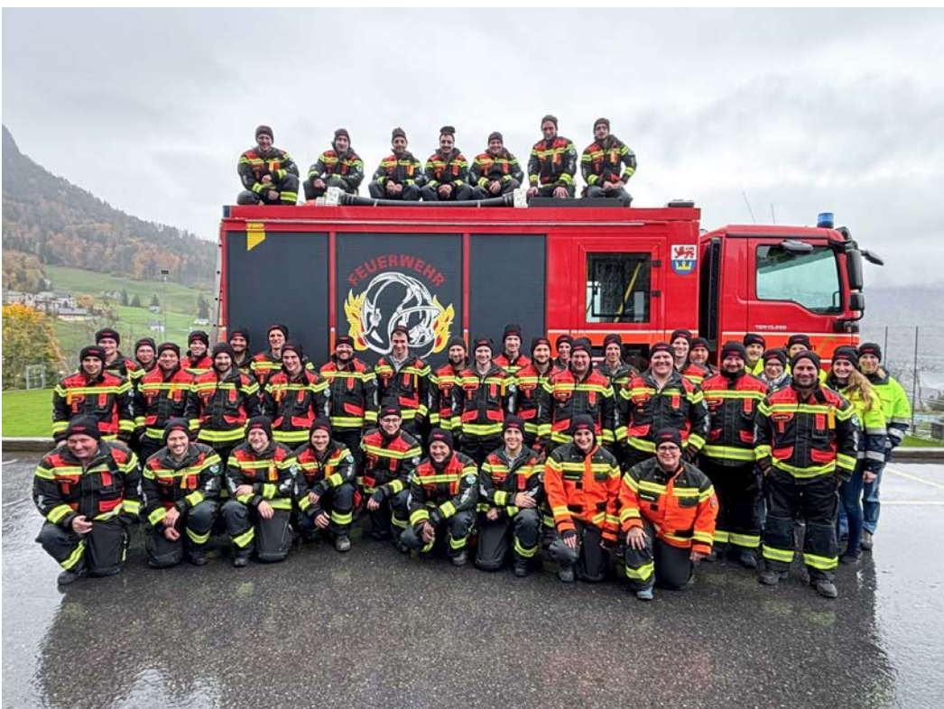
Die Feuerwehr Amden im neuen Outfit: Noch mehr Sicherheit – auch für Sie!

Nach intensiver Planung und Evaluation konnte die gesamte Feuerwehrmannschaft nach der Hauptübung die neuen Brandschutzkleider ein erstes Mal anziehen. Die neue Ausrüstung, hergestellt im Tessin, stammt von der Firma Hautle AG. Sie erfüllt die aktuellen Sicherheitsstandards und bietet den Feuerwehrangehörigen einen deutlich besseren Schutz bei Einsätzen im Brandfall. Gleichzeitig sorgt das moderne Material für mehr Bewegungsfreiheit und höheren Tragkomfort. Damit ist die Mannschaft optimal für die vielfältigen Herausforderungen im Einsatz gerüstet. Auch in Zukunft ist die Feuerwehr auf junge Leute angewiesen, auch Neuzuzüger werden gerne aufgenommen. So soll in Zukunft die Sicherheit weiter gewährleistet sein.