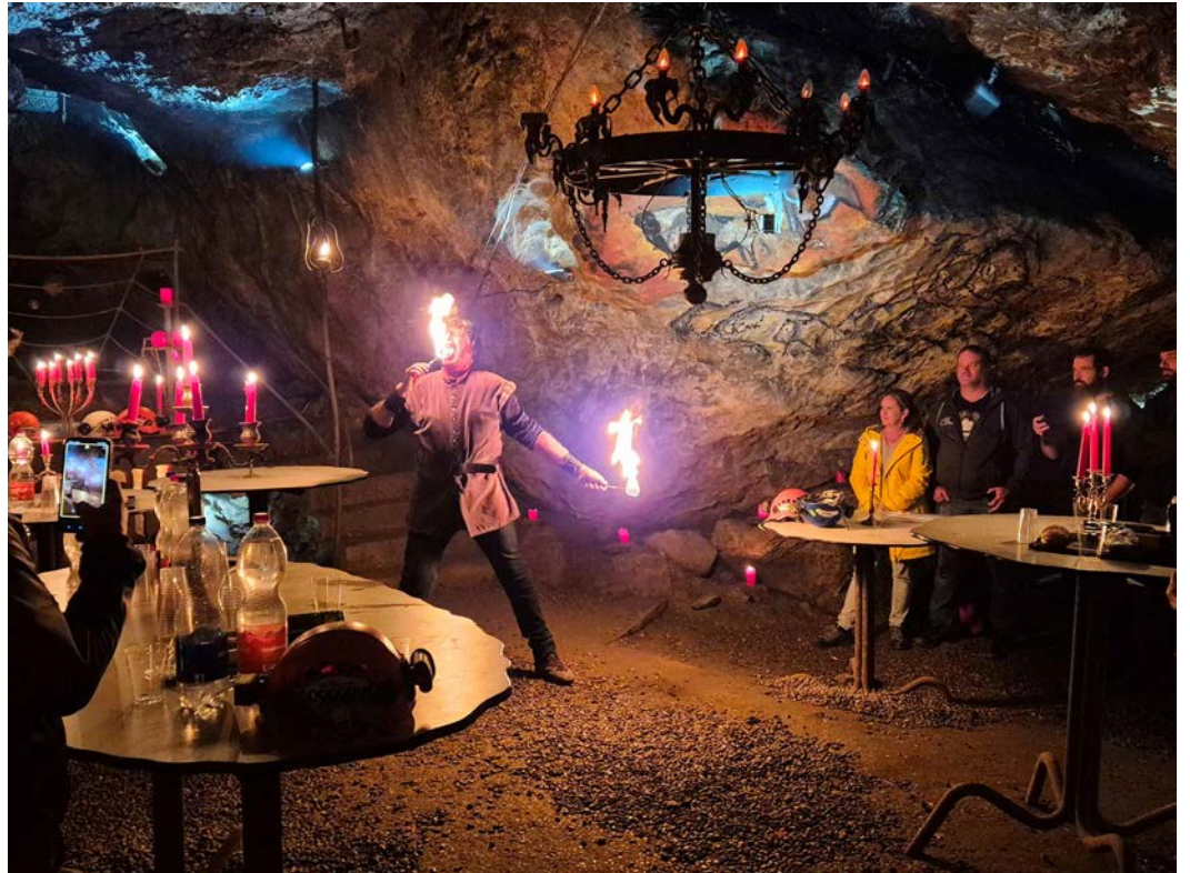
Der Höllochteufel ist ein Meister in der Kunst des Feuerschluckens.

Weiter ging es dann in die namensgebende Höhle in unmittelbarer Nähe des Restaurants. Im Besucherzentrum wurde die Gruppe in Empfang genommen und höhlentauglich ausgerüstet. Mit 212 km erforschter Länge gehört das vor 150 Jahren entdeckte Hölloch zu den grössten Höhlensystemen der Welt. Unter fachkundiger und humorvoller Führung konnte der vorderste Teil besichtigt werden. Auf diesen ca. 600 m wurde gezeigt, wie die wenigen tierischen Bewohner in der kargen Höhle überleben können, wie versteinerte Meeresmuscheln ins Muotatal gelangten und vieles mehr. Zum Abschluss dieses eindrücklichen Nachmittags wurden unsere Höhlenforscher mit einem Apéro bei Kerzenschein belohnt. Und man stelle sich vor: Der Höllochteufel höchstpersönlich erschien der Gruppe. Wie es sich für einen richtigen Teufel gehört, ist er ein Meister in der Kunst der Feuerschluckens. Einige mutige Damen durften ihm sogar bei seiner Show assistieren. Nach diesem feurigen Erlebnis stand die Heimfahrt an, die der ein und