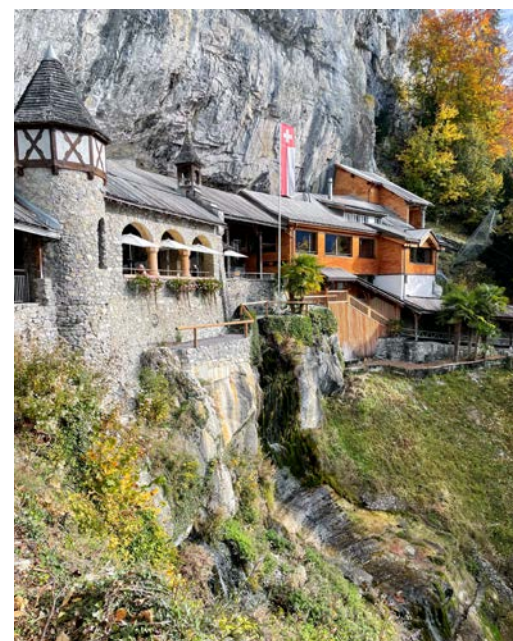
Den Eingang zu den St. Beatus-Höhlen erreicht man nach einem kurzen Aufstieg.

Stehen in Ihrem Garten Bäume und Sträucher, die Sie zurückschneiden oder entfernen möchten? Kontaktieren Sie uns, wir beraten Sie gerne.