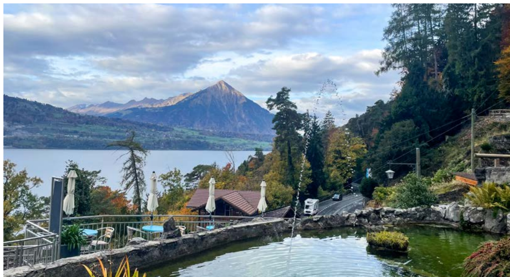
Eine herrliche Aussicht zur Bergkette mit dem Niesen beim Thunersee.