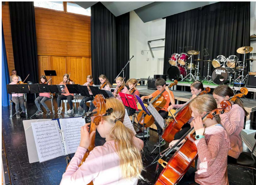
Als Gast dabei: Streicherensemble «Da Capo»