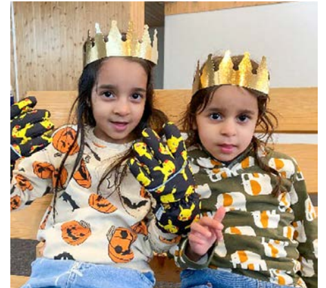
© Brigitte Tiefenauer und Sharifa Hossainy