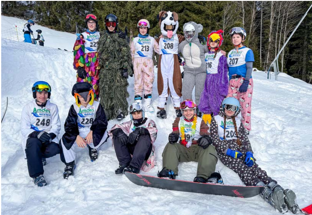
Verkleidete Lernende der 3. Oberstufe

Die Rangliste und weitere Fotos der Veranstaltung finden Sie auf der Homepage der OSWA ( www.oswa.ch ).