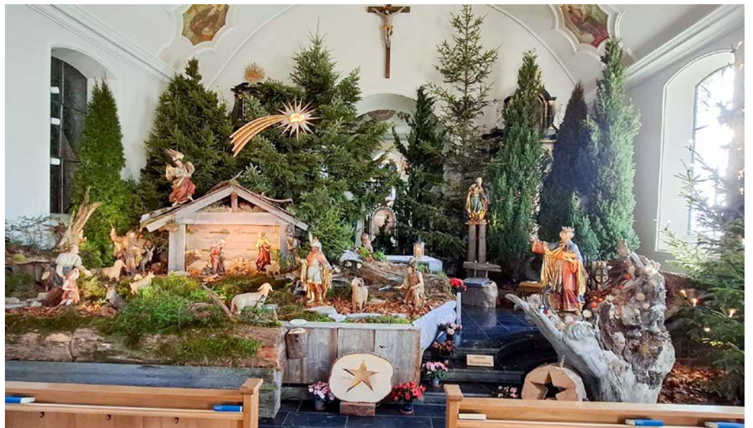
Herzblut und viel Liebe stecken jedes Jahr in der Krippenlandschaft.