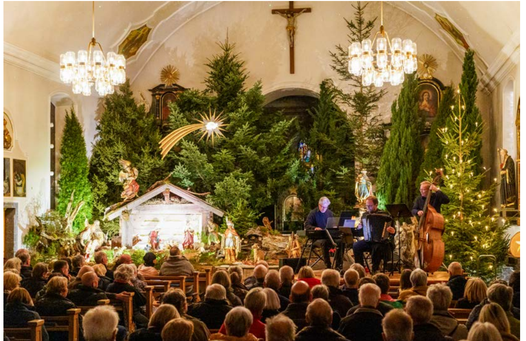
Was für eine Kulisse: Das Neujahrskonzert von AWT lockte viele Interessierte an.