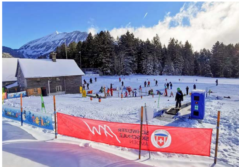
Am 4. Januar konnte der Zauberteppich im Kinderland der Skischule in Betrieb genommen werden.

Es ist ein Uhr. In einer Stunde startet der Unterricht. Noch sind keine Kinder hier, und wir wissen nicht, wie viele in der kommenden Stunde eintreffen werden. Anmelden muss man