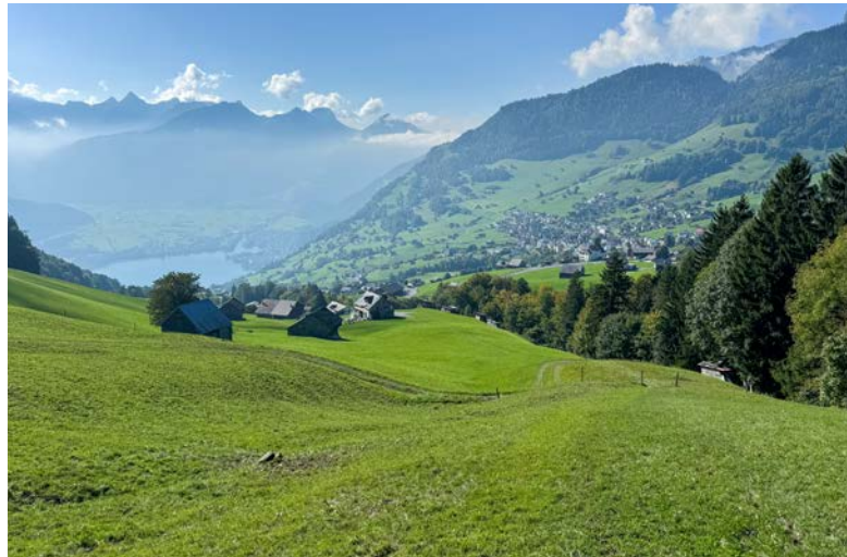
Im Gebiet Stocksitten werden öffentliche Abwasserleitungen ersetzt.

Die Politischen Gemeinden Amden und Weesen verlängern ihre Leistungsvereinbarung mit Amden Weesen Tourismus (AWT) um ein Jahr. Die aktuelle Vereinbarung ist Ende 2025 ausgelaufen und sollte ursprünglich erneuert werden. Aufgrund personeller Wechsel bei AWT und offener Finanzfragen konnten die Gespräche im vergangenen Jahr jedoch nicht wie geplant abgeschlossen werden. Die Verlängerung der Leistungsvereinbarung bis am 31. Dezember 2026 stellt sicher, dass AWT seine Aufgaben weiter erfüllen kann. Dazu gehören die Gästeberatung, das Kurtaxenwesen für die beiden Gemeinden, die Pflege touristischer Angebote und die Vermarktung der Destination. Amden leistet dafür wie bisher einen Jahresbeitrag von 35'000 Franken sowie die vollständigen Kurtaxenerträge. Die Auszahlung der Gemeindebeiträge steht unter dem Vorbehalt der Budgetgenehmigung durch die Bürgerschaften beider Gemeinden im Frühjahr 2026. Parallel zur Übergangslösung startet die Erarbeitung einer neuen, inhaltlich aktualisierten Leistungsvereinbarung ab 2027. Diese soll bis Mitte 2026 vorliegen und die künftige Zusammenarbeit auf eine neue Basis stellen.