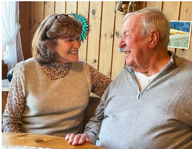
Dankbar für das gegenseitige Dasein – die Liebe blüht auch nach 65 Jahren!