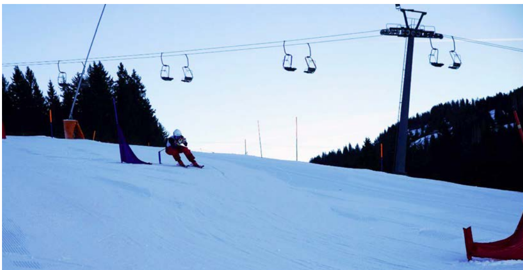
Reto Gmür auf der Fahrt zum Clubmeister.