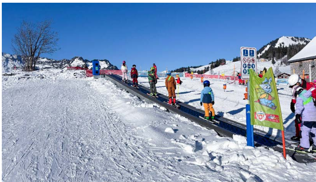
Auf dem neuen Zauberteppich: spannende erste Erfahrungen für die Kinder