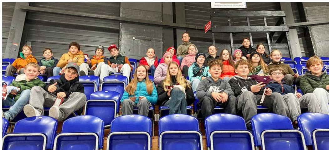
Verfolgen gespannt das Hockey-Duell: Schülerinnen und Schüler der 1. Oberstufe.

Die Partie war von Anfang bis Ende spannend. Nach regulärer Spielzeit und Verlängerung stand es 0:0 – ein seltenes Ergebnis im Eishockey! Beide Torhüter zeigten überragende Leistungen und hielten ihre Teams im Spiel.