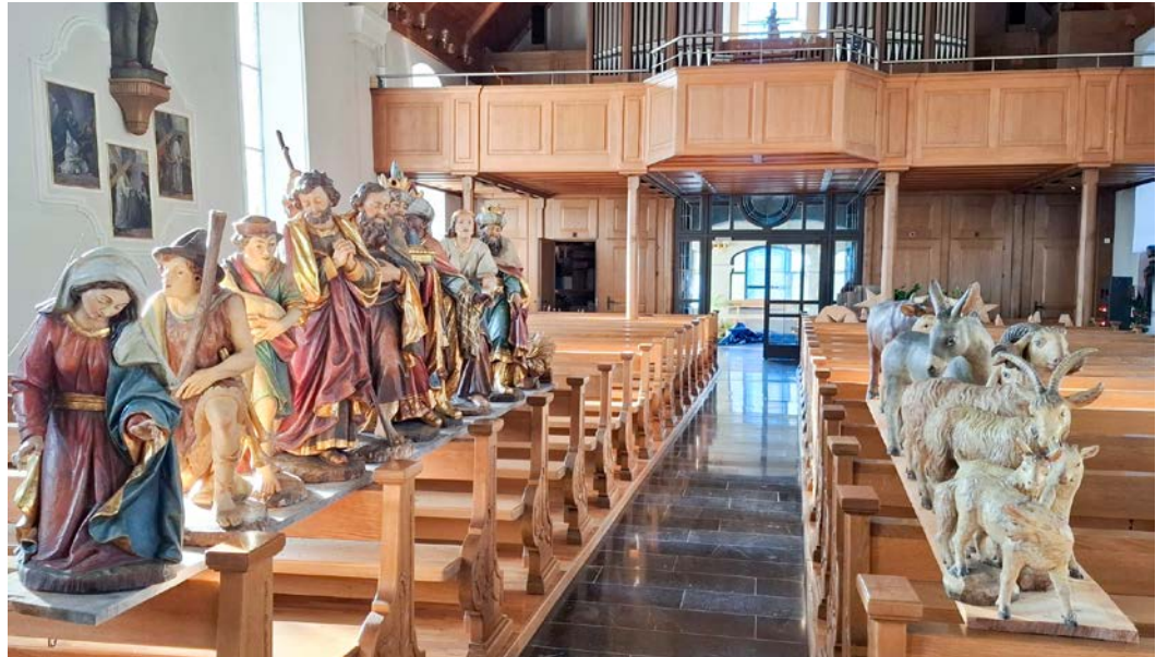
Die handgefertigten Krippenfiguren werden wieder sorgsam versorgt. Sie sind aus Arvenholz und kommen aus Südtirol.