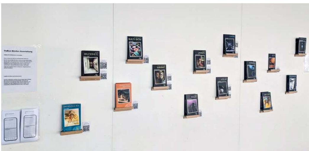
Buchausstellung im Schulhaus