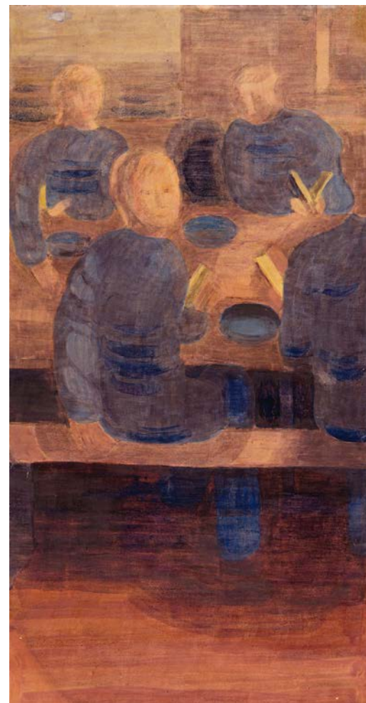
Dieses bekannte Bild zeigt Eindrücke aus der Morgendandacht im Waisenhaus in Bern, wo Meyer-Amden die Schulzeit verbrachte. Es existieren verschiedene Fassungen, welche zu seinen Hauptwerken gehören.

Wenn ich hier in Amden bin, führt mich mein erster Schritt nach dem Aufstehen zum Fenster