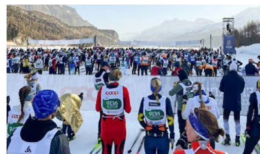
In gespannter Erwartung: Start des Engadin Skimarathons 2026