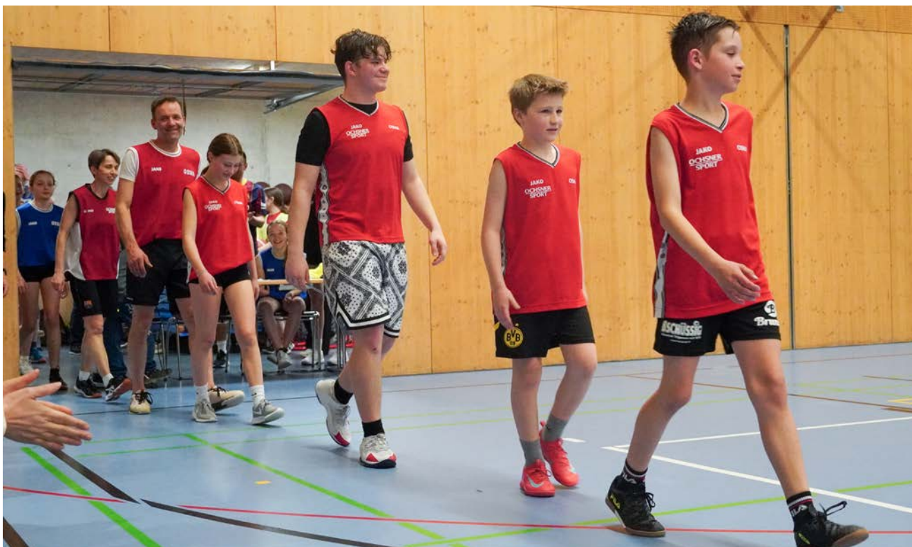
Einmarsch der zwei Finalmannschaften

Weitere Fotos der Veranstaltung finden Sie auf www.oswa.ch .