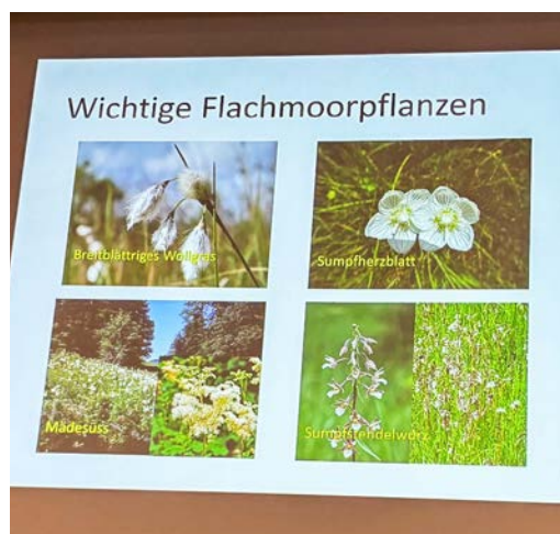
Flächen mit solchen Pflanzen werden auch künftig von der Schutzverordnung erfasst.

schutz – spricht: die Gebäude – werde später behandelt. Von was also reden wir? Bei den Naturschutzgebieten handelt es sich um Flach- und Hochmoore, Magerwiesen und -weiden, Biotop und Pufferzonen. Von der Schutzverordnung umfasst werden weiter Hecken, Baumgruppen und Einzelbäume. Von all diesen Objekten gebe es in Amden besonders wertvolle, hiess es. Im Rahmen der Präsentation erfuhr man, welche wichtigen Pflanzen in den einzelnen Schutzobjekten vorkommen können.