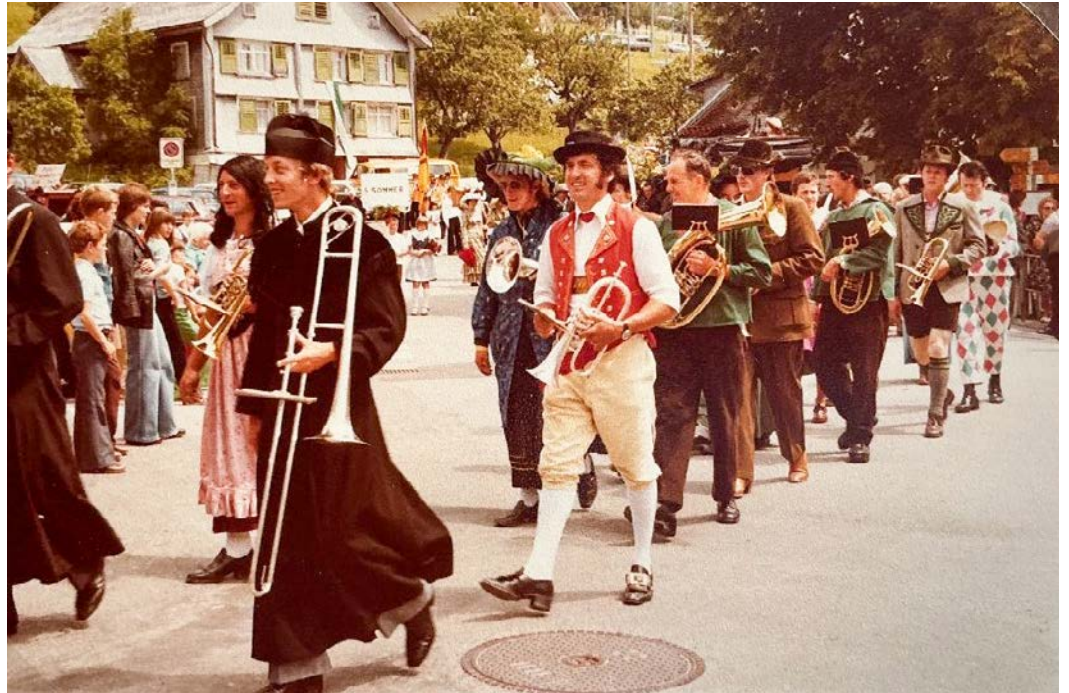
Wer dabei war, erinnert sich gern daran: Die Musikgesellschaft an der 800-Jahr-Feier in Amden

48 Jahre ist es also her, dass die Bevölkerung von Amden das 800-jährige Bestehen ihres Dorfes gefeiert hat. Wer an jener 800-Jahr-Feier mit dabei war, erinnert sich mit Freude an eines der schönsten, eines der festlichsten Ereignisse, das je in Amden stattgefunden hat.