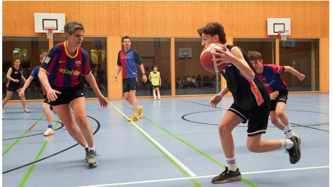
Es wurde um jeden Ball gekämpft.

Während der Vorrunde spielten je fünf Teams in zwei Gruppen um den Einzug ins Halbfinale. Geleitet wurden die Spiele von Schiedsrichterduos, welche sich aus Lernenden der 1. Oberstufe und Gästen der ehemaligen 3. Oberstufe zusammensetzten. Die zahlreichen Zuschauerinnen