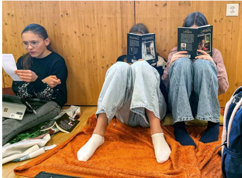
Lesen ist faszinierend und macht Spass.

Die Bücher sind nun im Schulhaus ausgestellt. Über einen QR-Code können die Trailer angewählt werden. Alle Interessierten sind sehr