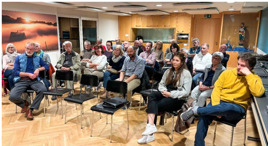
Lauschen aufmerksam den Erklärungen des Gemeinderates: Gäste der ersten «Offenen Fragerunde».

Ein weiterer Schwerpunkt war die Zukunft der Restaurants. Inwieweit soll die Gemeinde aktiv werden, wenn ein Restaurant die Tore schliesst? «Einzelne Mitbürgerinnen und Mitbürger er-