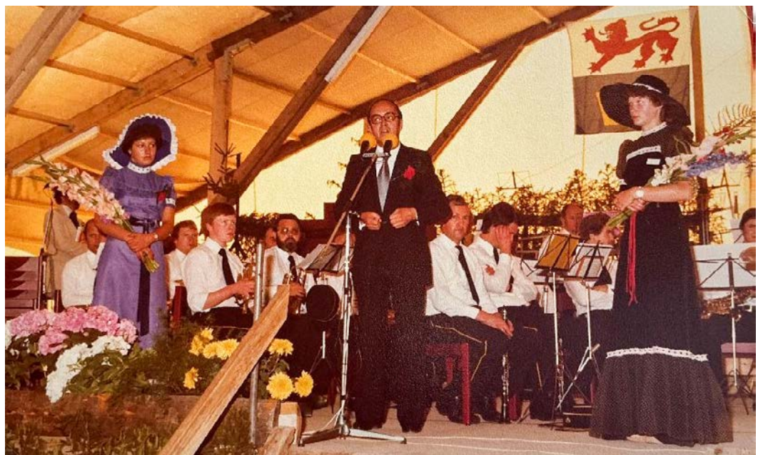
Vor 48 Jahren: Der damalige Bundesrat Kurt Furgler wendet sich an die Ammler Bevölkerung.