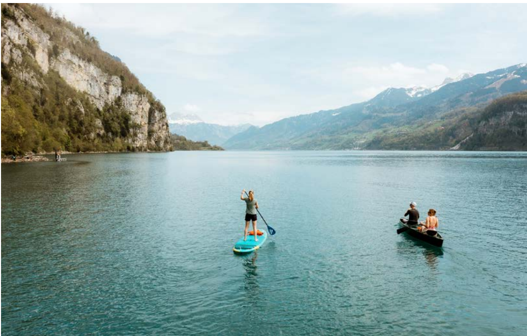
Ab dem 1. Mai 2026 können im Lago Mio selbstständig Stand Up Paddles (SUPs), Kajaks und Kanus gemietet werden.

Die Bevölkerung ist herzlich eingeladen, das neue Wassersportzentrum ab dem 1. Mai zu entdecken und das vielseitige Angebot am Lago Mio zu nutzen. Mit dem Rabattcode «SAISON-START» besteht die Möglichkeit, die Wassersportgeräte im Mai und Juni vergünstigt zu buchen und auf dem See auszuprobieren.