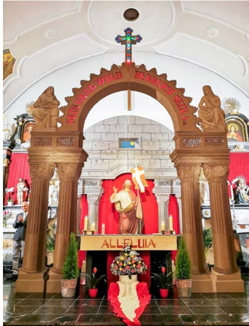
Der Altar zu Ostern in der Galluskirche