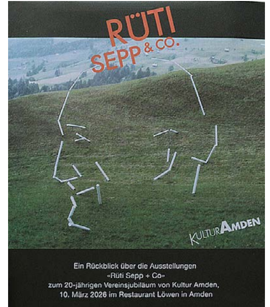
Rüti Sepp + Co.: Ammler Älpler im Porträt. Die DVD inklusive USB-Stick ist im Tourismusbüro Amden erhältlich. © Verein Kultur Amden

Das Buch «Kunst Amden» und der Film «Rüti Sepp + Co.» (DVD/USB-Stick) sind bei Amden Weesen Tourismus erhältlich.