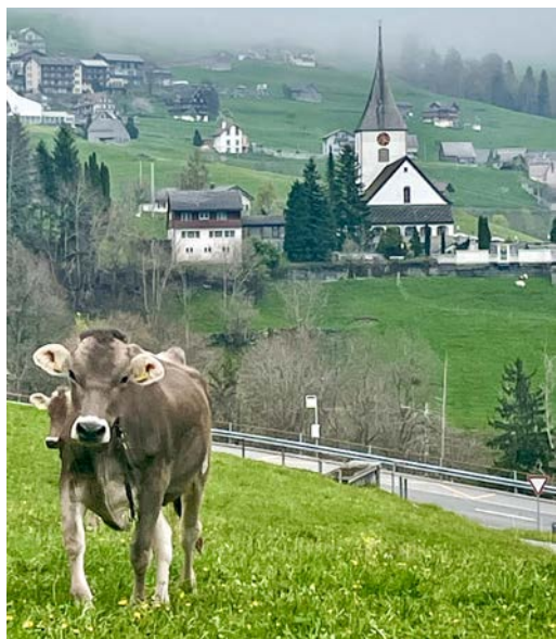
Die Galluskirche unter dem Hochnebel.