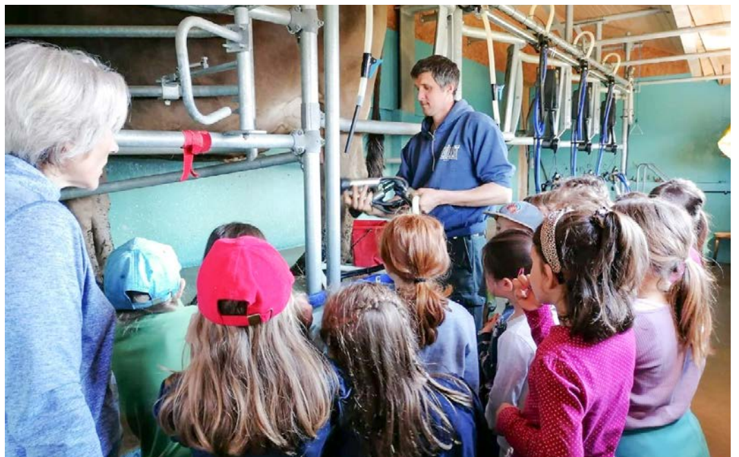
Lernen auch ausserhalb des Schulzimmers: Schülerinnen und Schüler besuchen einen Bauernhof.

Sowohl die Rechnung als auch das Budget genehmigten die Stimmberechtigten ohne Wortmeldung.