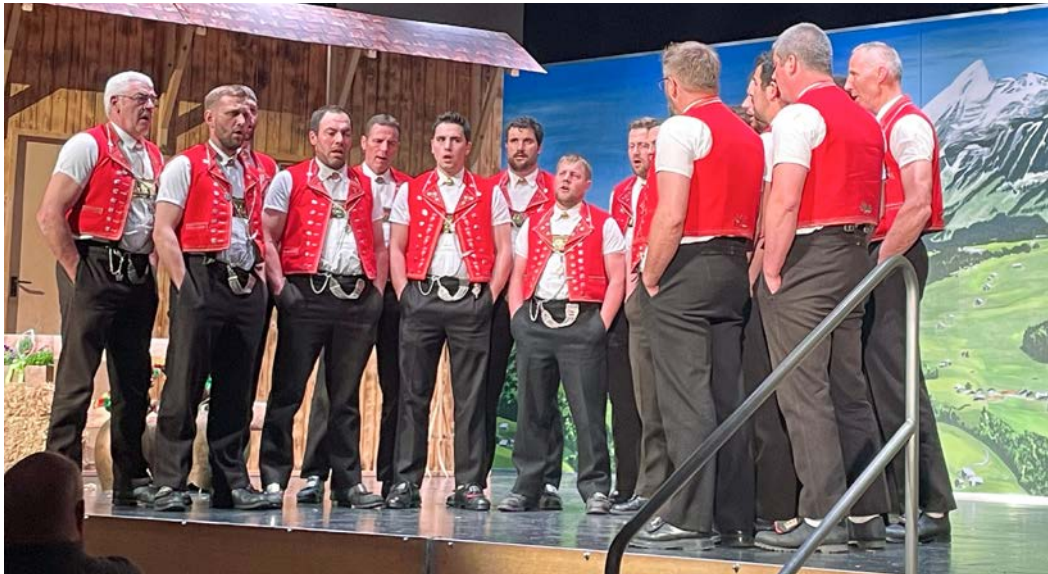
Die Nachbarn gleich hinter dem Berg: Der Jodlerklub Männertreu lässt die Tradition hochleben.