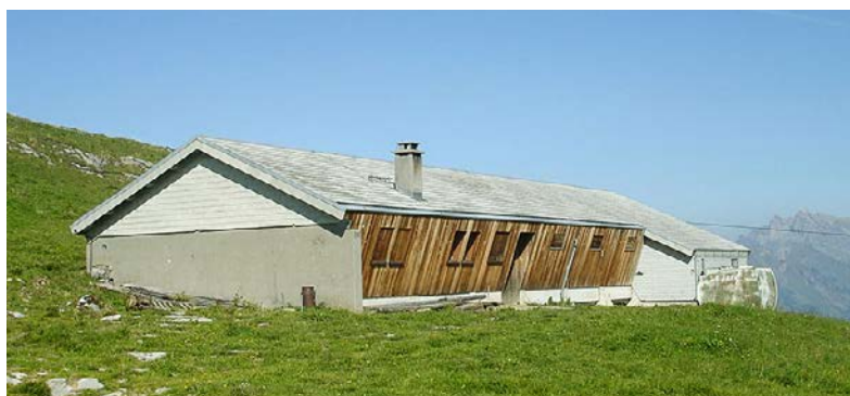
Auf der höchstgelegenen Alp Gulmen (1788 m ü. M.) erfolgte ein Pächterwechsel. Weitere Bilder von den Ammler Alpen findet man auf der neuen Webseite www.og-amden.ch .