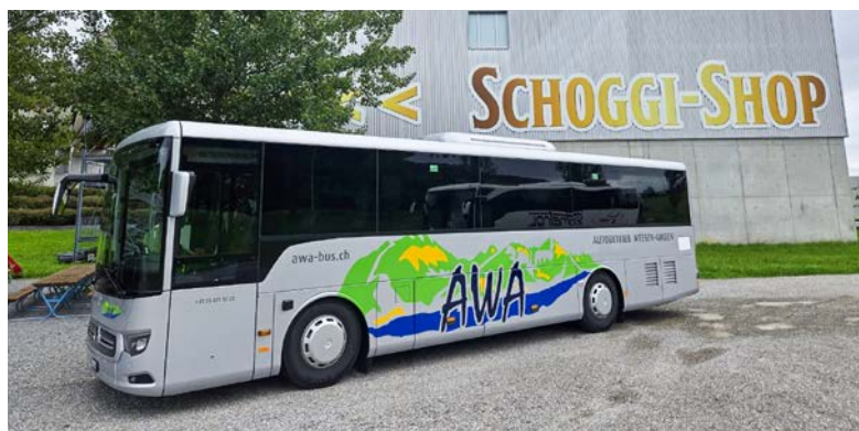
Der neue Reisebus bietet grossen Komfort und darf gerne beim Autobetrieb gebucht werden.