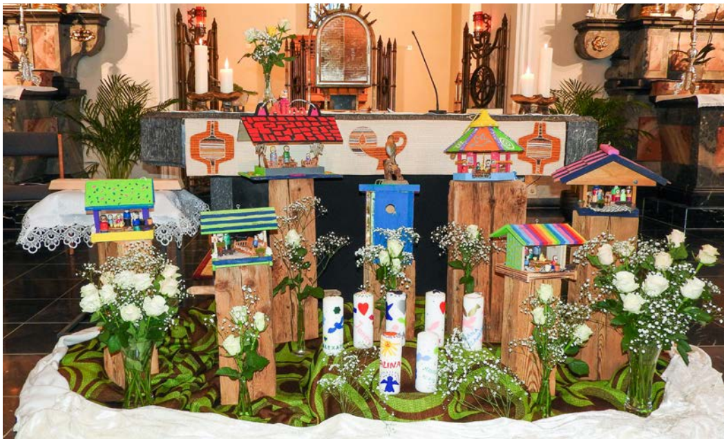
Farbig bunt haben sich die Kinder ihre Wohnung bei Gott vorgestellt und gebastelt.

Ein Apéro auf dem Kirchplatz mit weiteren Stücken der Musikgesellschaft Amden wird dankbar angenommen, bevor alle individuell mit den Erstkommunikanten im kleinen Kreis der Familie weiterfeiern und den Weissen Sonntag ausklingen lassen.