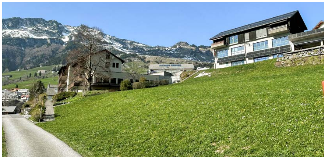
Die Politische Gemeinde Amden und die Ortsgemeinde Amden planen den gemeinsamen Kauf des «Alverna-Areals».

Das Institut Menzingen ist Eigentümerin des Grundstückes Nr. 134 (Alverna). Auf dem nordwestlichen Teil des Grundstückes, das sich in der