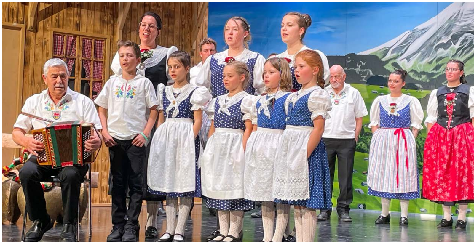
Die Ammler Bergspatzen – Nachwuchs für die Grossen?

Der Jodlerklub Männertreu aus Nesslau darf auf eine lange Vereinsgeschichte zurückblicken: Seit 1911 gibt es den Klub. In den letzten hundert Jah-