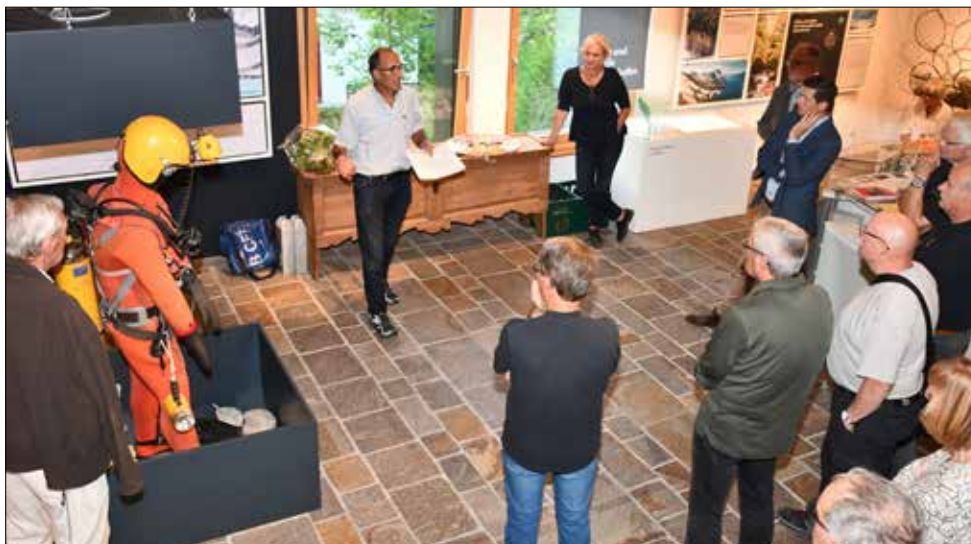
Vom bäuerlichen Bergdorf zum Tourismusort: Das Museum in Amden stellt die Geschichte und die Entwicklung dar.