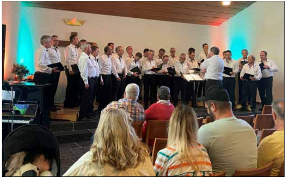
Männerchor in der Bergkirche