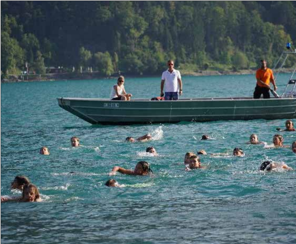
Die Seerettung hielt ein wachsames Auge auf die Schwimmer/-innen.