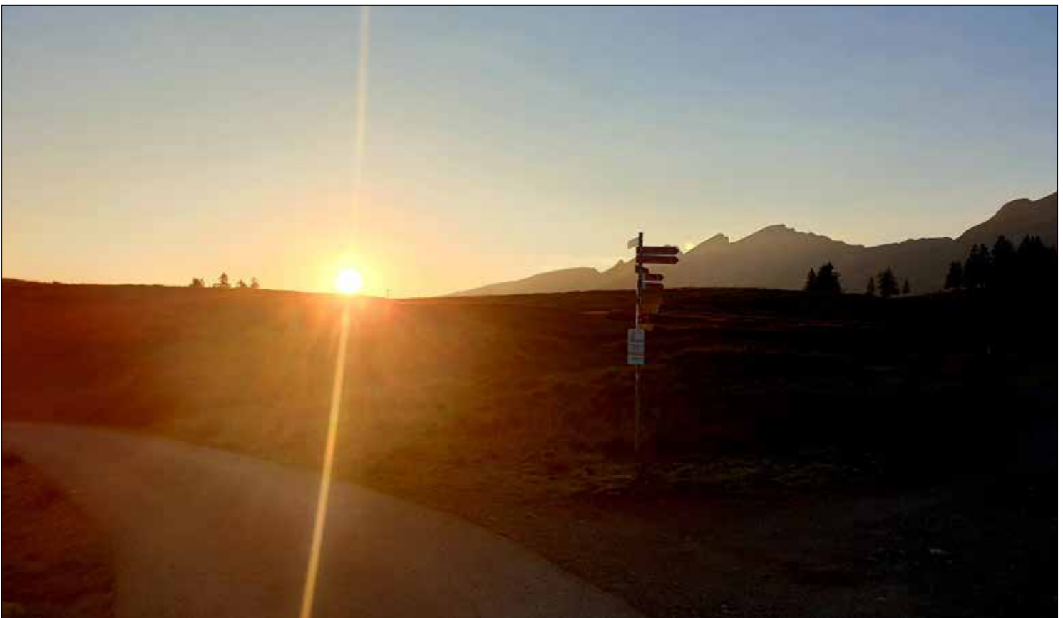
Sonnenaufgang auf der Vorderen Höhi