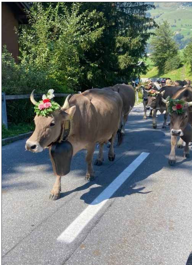
Alpabzug in der Arvenbuelstrasse