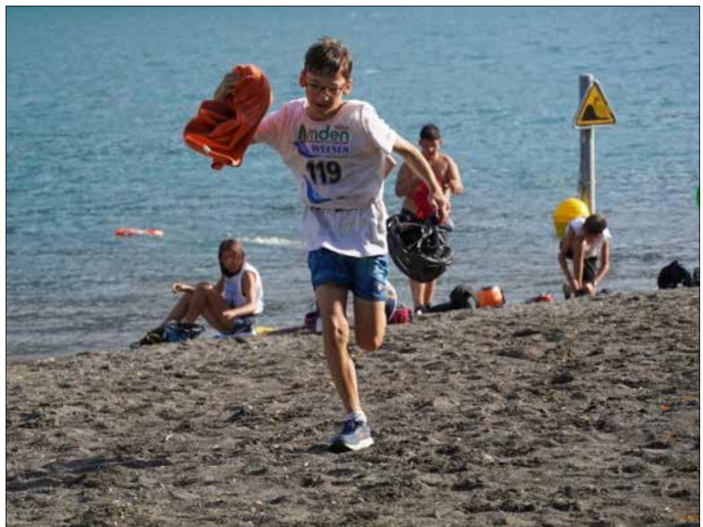
Nach dem Umziehen gings so schnell wie möglich zum Velostart.