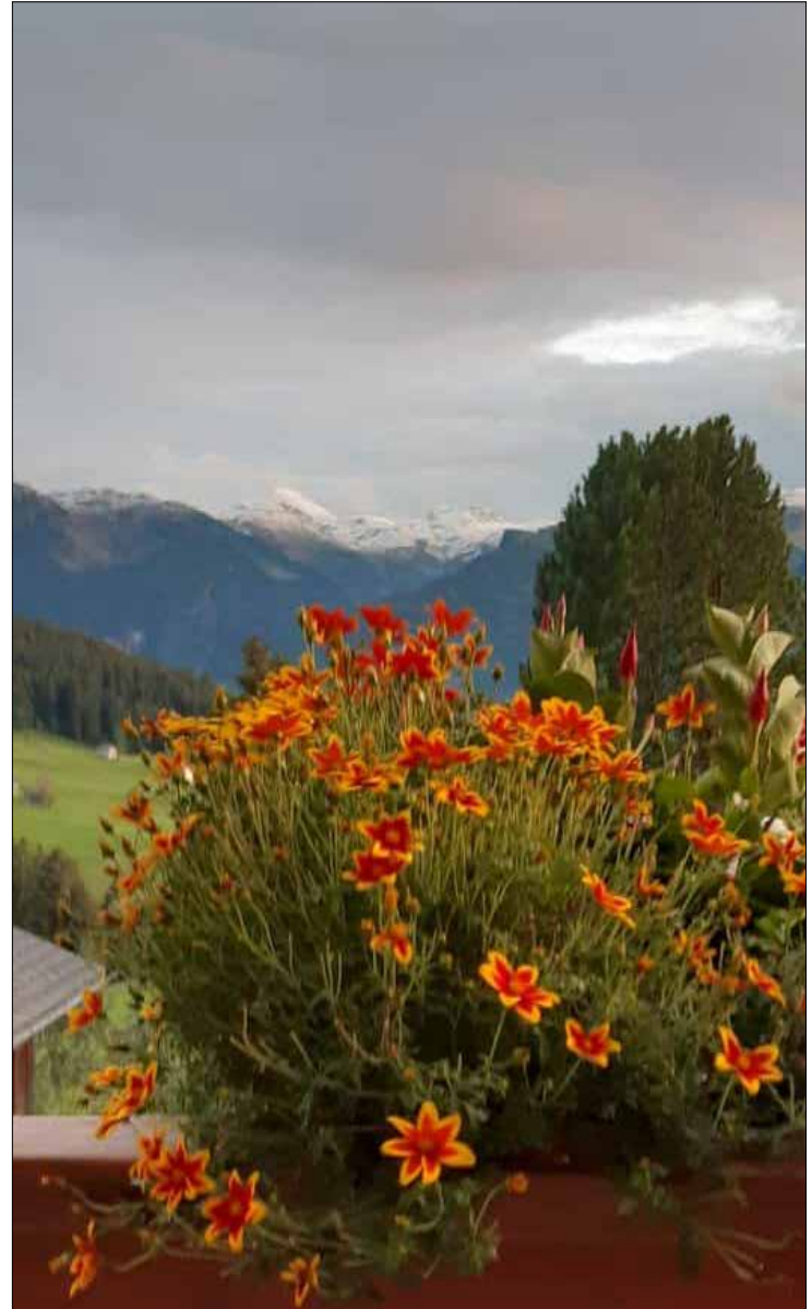
Frau Holles erster Herbstgruss