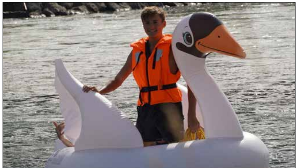
Amüsante Ankunft bei der Grynau