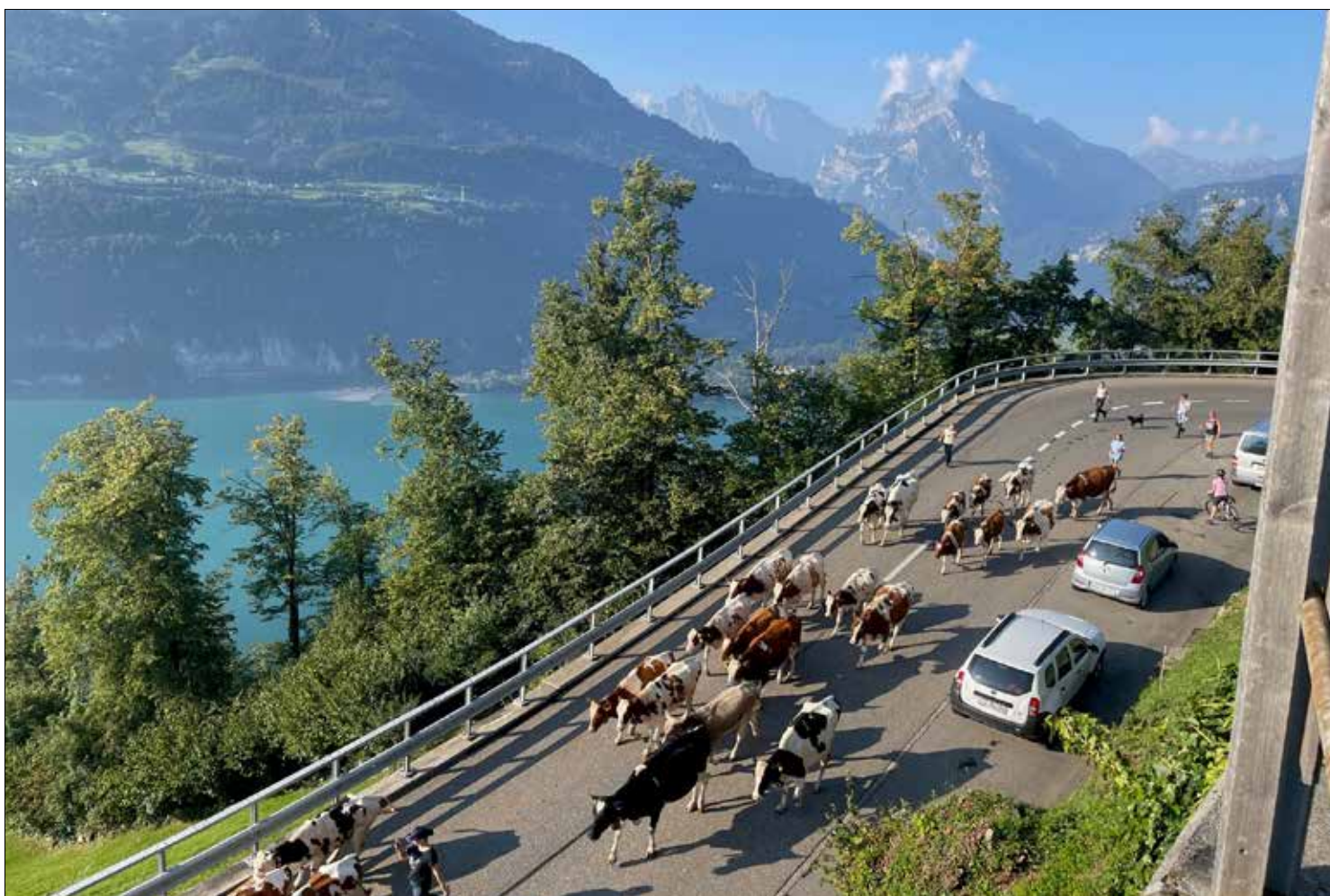
Alpabzug beim Portrank