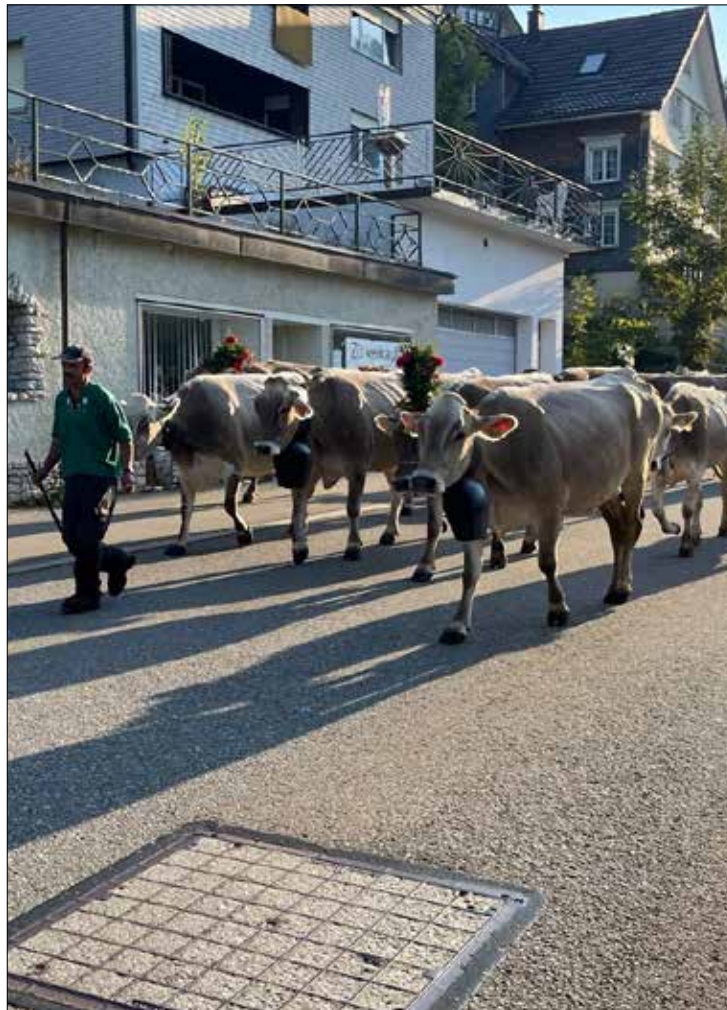
Alpabzug im Dorf