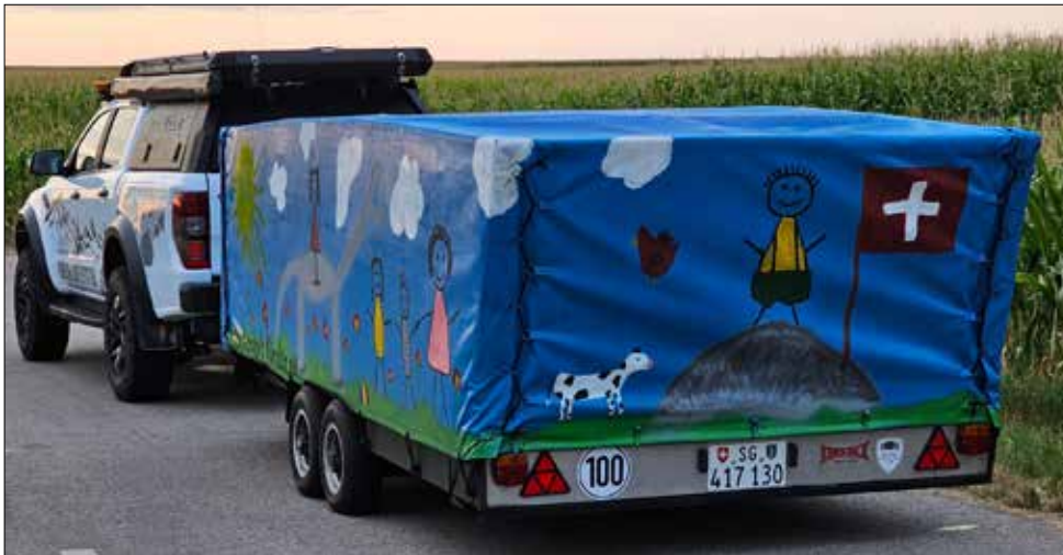
Auf nach Rumänien