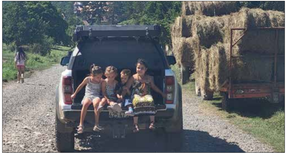
Kindertreff im Kofferraum

Die Sorgen holten uns jedoch wieder ein, als wir im wunderschönen Donaudelta waren. 13 Kilometer entfernt brannten 40'000 Tonnen Getreide im ukrainischen Hafen Ismajil durch russische Anschläge. Die Rauchwolke war drei Tage lang zu sehen. Im Delta charterten wir uns ein kleines Boot mit lokalem Führer. Die Natur zu erleben, mit Pelikanen, Adlern, Ibissen und zahlreichen anderen Wassertieren war gerade für die Kinder sehr intensiv und prägend. Am schwarzen Meer schliefen wir hoch über dem Strand im Dachzelt, tagsüber konnten wir an wunderbaren und fast leeren Sandstränden verweilen.