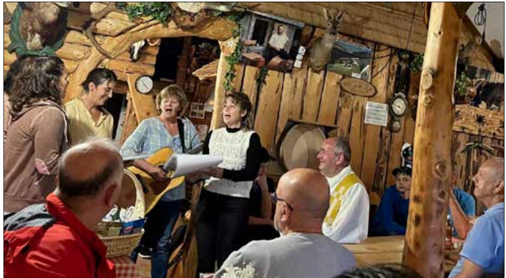
Musik und Gesang auf der Alp Strichboden