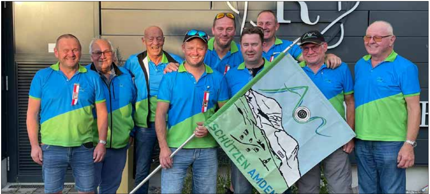
Schützen- und Fandelelegation aus Amden an den Schweizer Meisterschaften in Winterthur