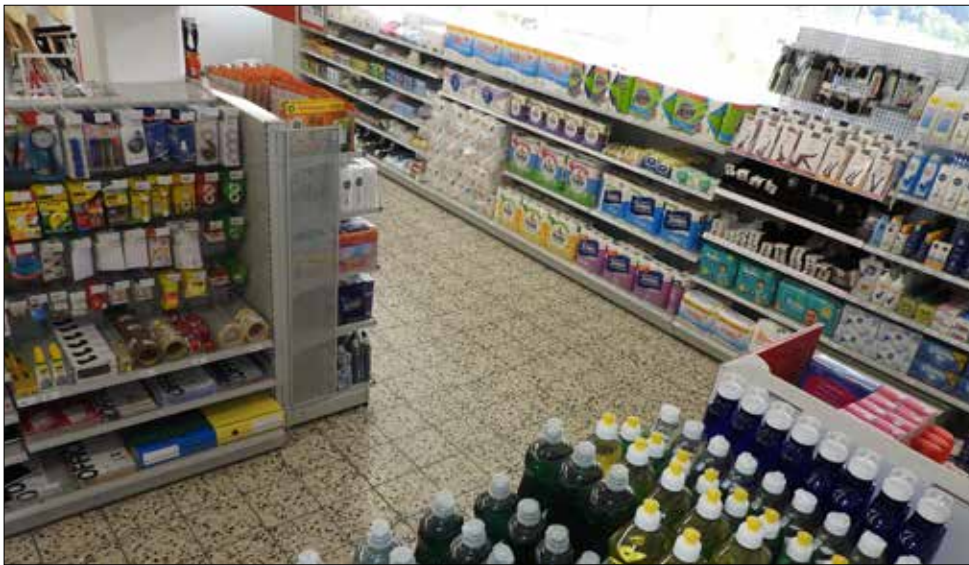
Im unteren Stock ist ein übersichtlicher Non-Food-Bereich entstanden.